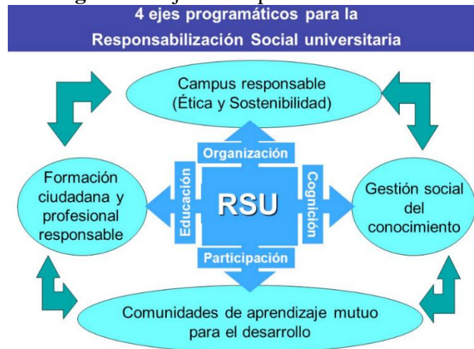
Figura 6.3 Ejes de responsabilidad social.