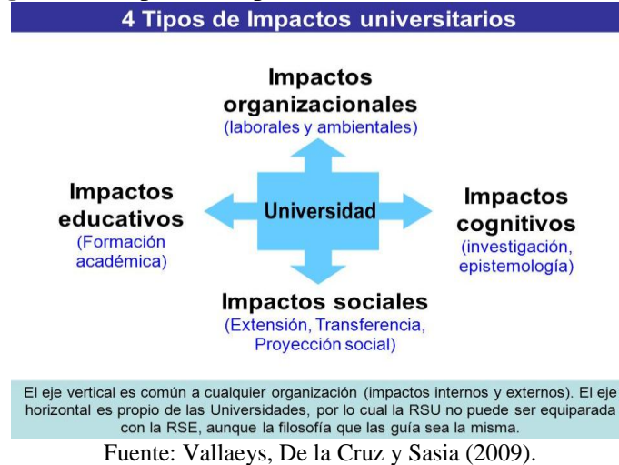
Figura 6.2 Tipos de impactos universitarios en el entorno.

Por su parte, Vallaeys, De la Cruz y Sasía (2009) identifican cuatro ejes de la RSU, los que se desprenden de los impactos generados por el quehacer universitario señalados anteriormente: campus responsable, formación profesional y ciudadana, gestión social del conocimiento y participación social, como muestra la Figura 3.